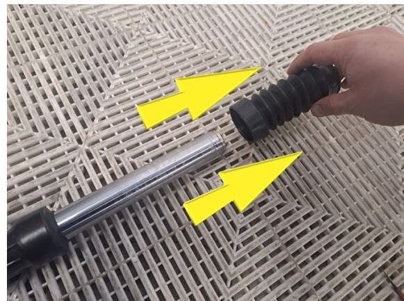
Ota etujousen suoja pois.

Uuden osan asennus käänteisessä järjestyksessä.