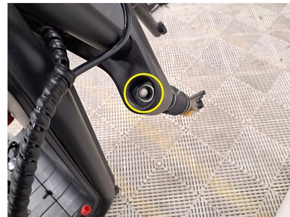
Irrota oikeanpuoleisen etujousen kiinnityspultti. (hylsy 12 mm).