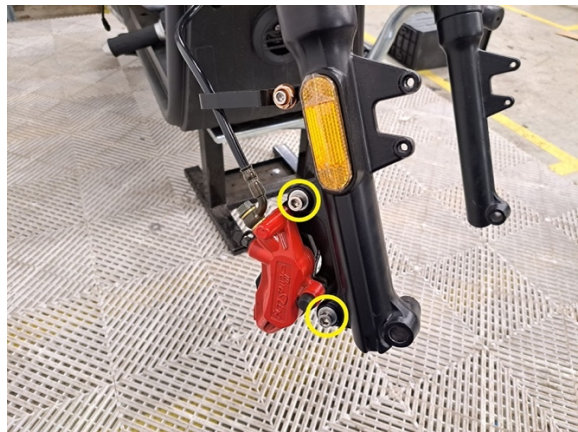
Irrota etujarrusatulan kaksi kiinnityspulttia. (kuusiokoloavain 6 mm).