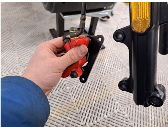
Siirrä jarrusatula sivuun.