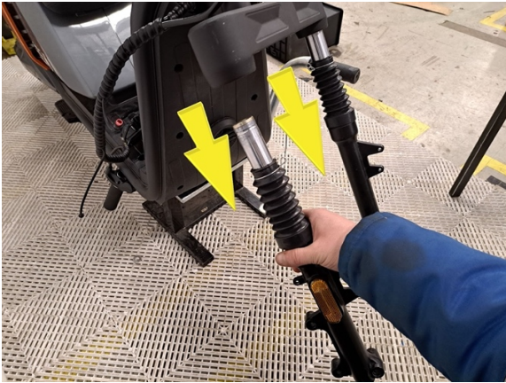
Ota oikeanpuolen etujousi pois.