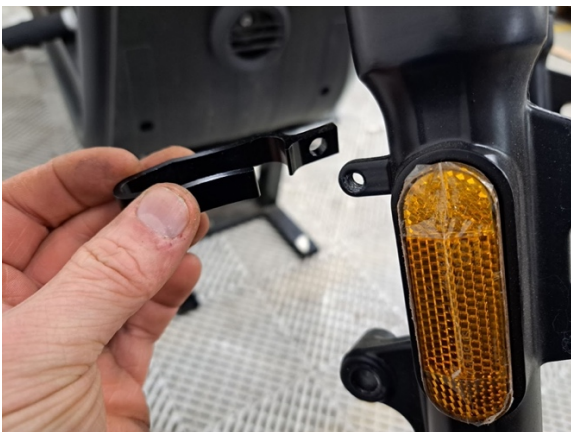
Ota etujarruletkun kannake pois.