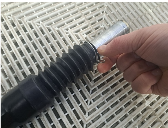
Irrota etujousen suojan kiinnike.