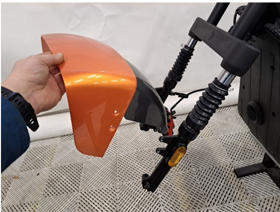
Ota etulokasuoja pois.